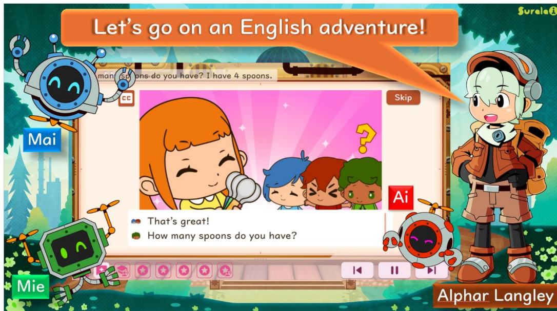
「小学校英語」イメージ：表情豊かなキャラクターと一緒に楽しく英語を学習できる。

すららネットが提供する「小学校英語」は、当社が開発を進める次世代デジタル学習サービス上で展開する英語学習コンテンツです。文字と音のルール（フォニックス）、英単語、英語表現の3つの学びを通して、中学校英語につながる土台を育てます。アニメーションによる対話型学習や豊富なアクティビティを通じて、子どもたちは楽しみながら英語に親しみ、自然と使える英語を身につけていきます。